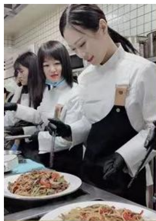
JSIDGBIUVDBIUGBUVSBUI IDUBHVDFBJOFG HOIKSALHDOIFIECFNONOIEFOPNRJVFKSGHOR