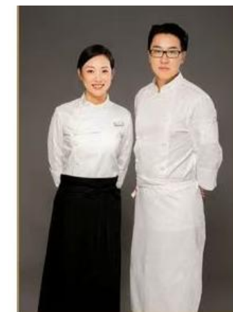
UBHVDFBJOFG HOIKSALHDOINONIEFOPNRJVFKSGHOR OIDFNGOIBDKNPSOOP