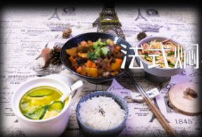
法式焗羊肉套餐 ..... ¥x元/份