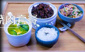
茶树菇红烧肉套餐