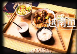
越南鱼露炸鸡套餐 ..... ¥x元/份