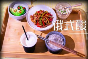
俄式酸黄瓜炒肉套餐 ..... ¥x元/份