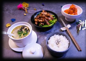
沙茶牛肉炒芥兰套餐 ..... ¥x元/份