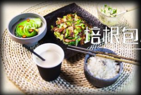
培根包心菜套餐 ..... ¥x元/份