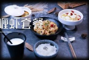
泰式椰香咖喱虾套餐