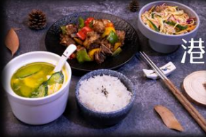
港式煎焗猪排套餐 ..... ¥x元/份