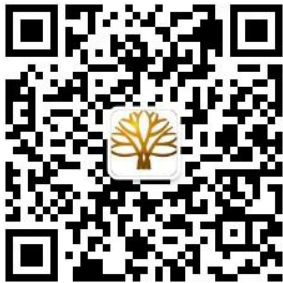
苏州兰德集团公众号